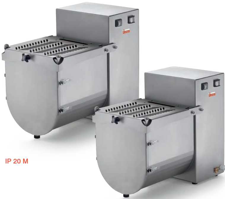
IP 20 M