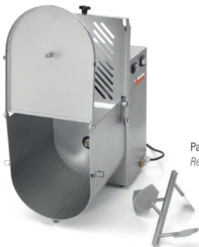
Pala facilmente rimovibile Removable mixing arm